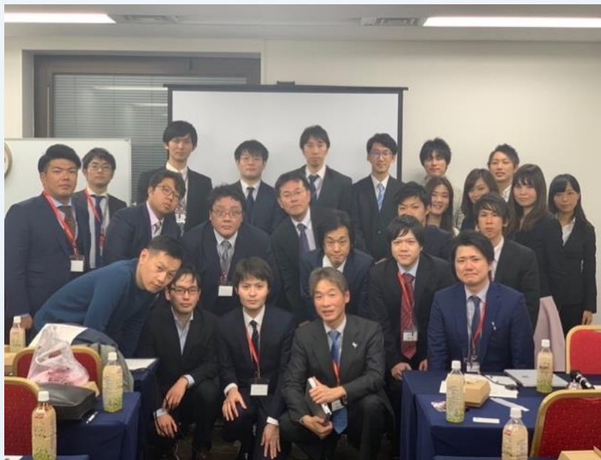
【第1回NEXT、2018年の肺癌学会にて】