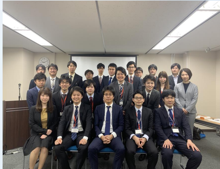
【第2回NEXT、2019年の呼吸器外科学会にて】